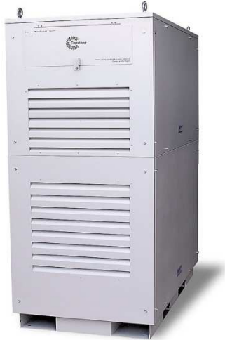
Groupe électrogène diesel CAPSTONE TURBINE 36 kVA