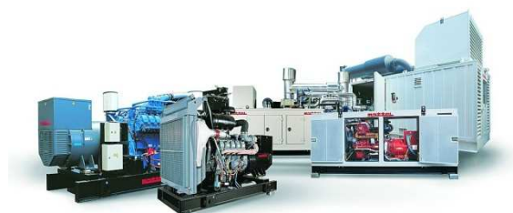
Groupe électrogène diesel SDMO 650 - 3000 kVA